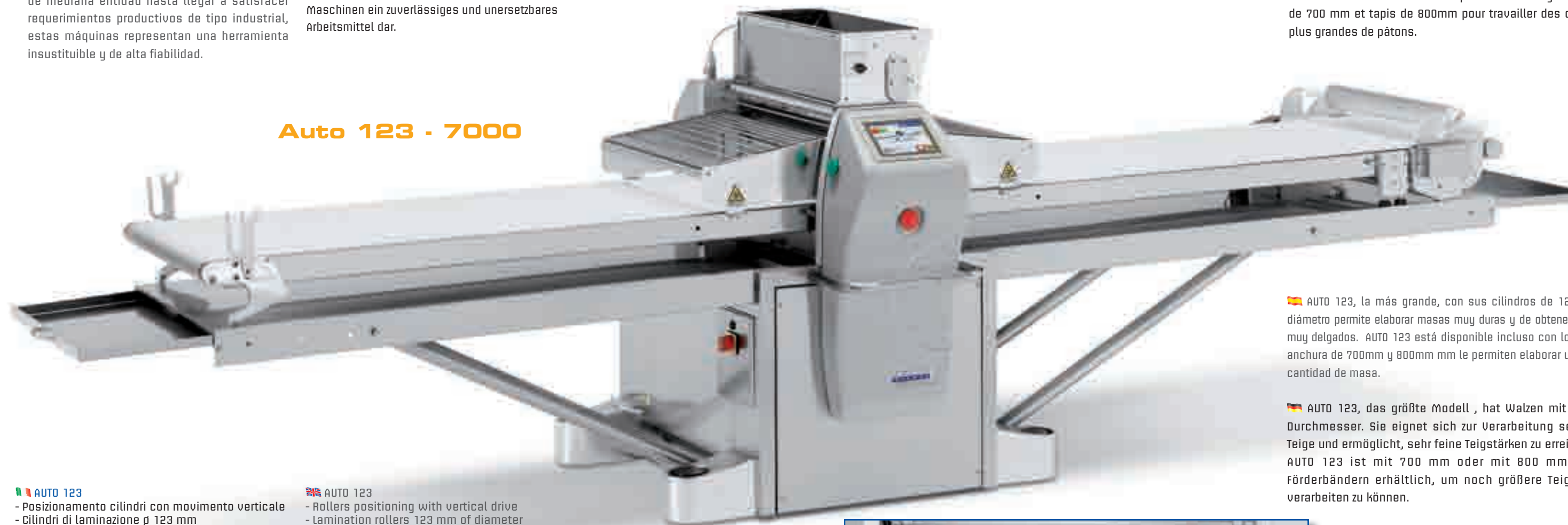
Auto 123 - 7000

IT Dispositivo di taglio a rulli (disponibile a richiesta per tutti i modelli)